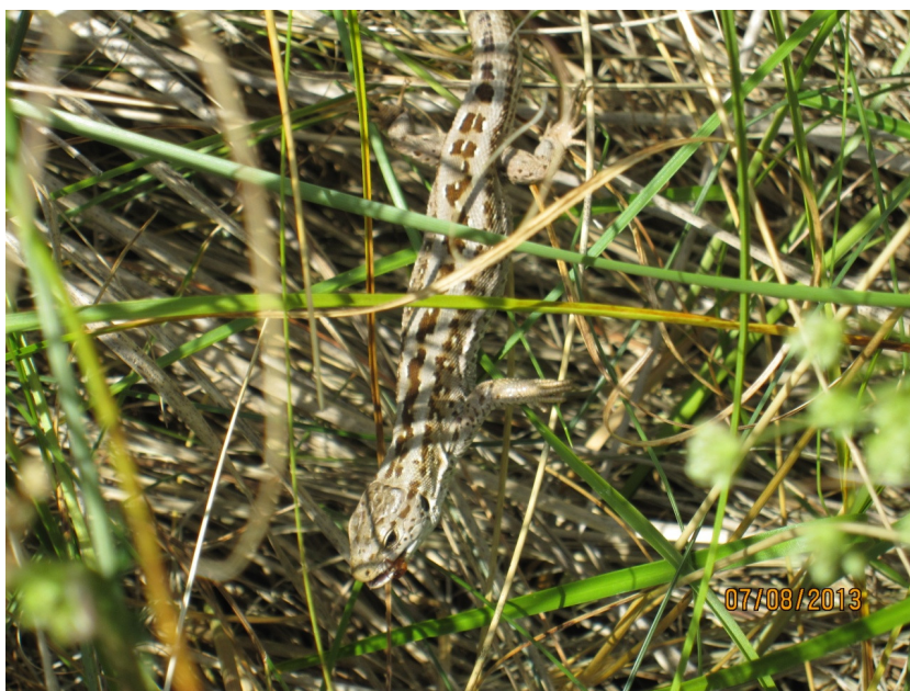
Markfirben ved Tirpitz

Udover markfirben er der ikke kendskab til forekomst af andre bilag IV-arter i det berørte område. Området har dog en karakter, der gør det velegnet som overvintrings- og rastelokalitet for bilag IV-arten strandtudse. Arten findes i denne del af kommunen, og da der er flere potentielle ynglelokaliteter inden for artens mulige vandringsafstand, vurderes det som muligt, at strandtudsens forekomst ved Tirpitz-bunkeren. Områdets betydning for strandtudsens er dog næppe væsentligt, da de potentielle ynglelokaliteter ikke virker optimale (bedømt ud fra luftfotos) og alle er beliggende i en afstand af mere end 700 m.